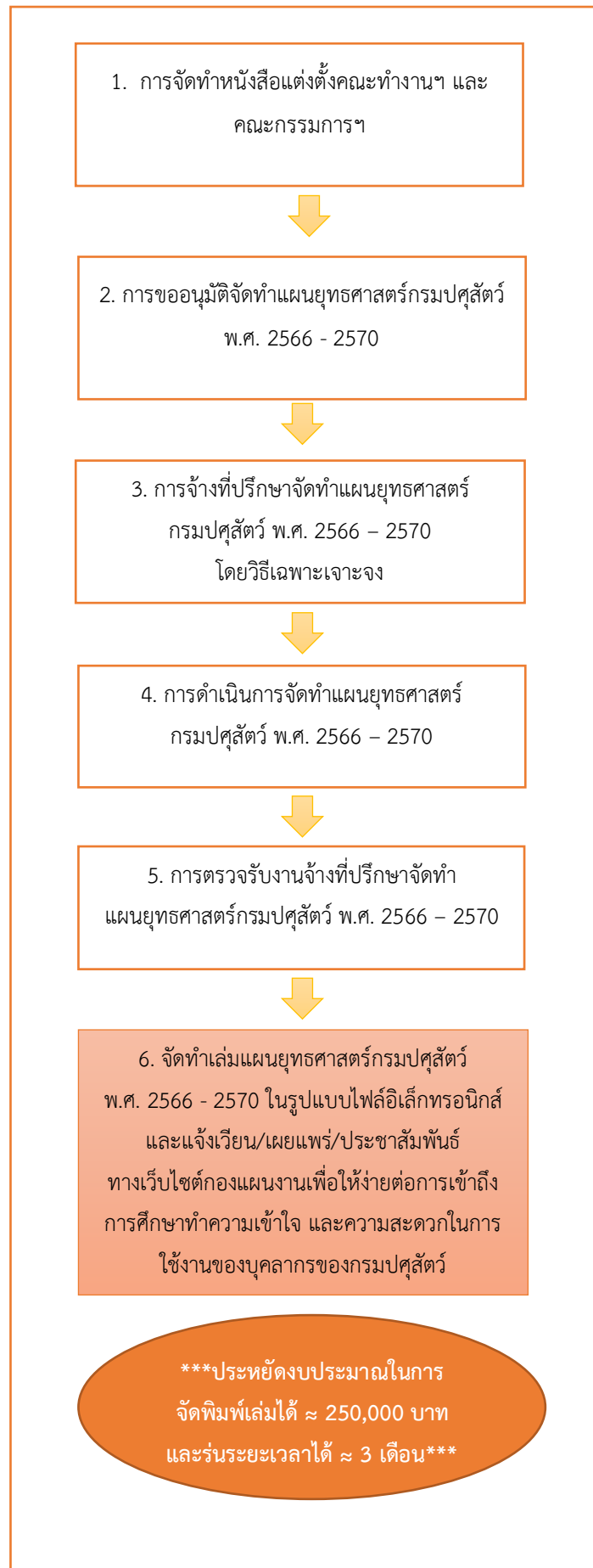
รูปแสดงขั้นตอน/แผนผังการปฏิบัติงานใหม่