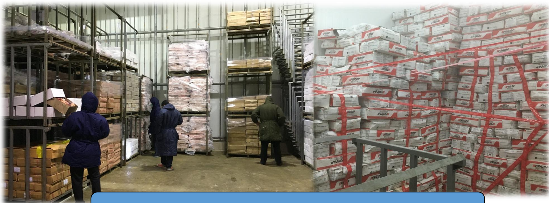
ภาพการปฏิบัติงานปราบปรามการลักลอบนำเข้าจากสัตว์