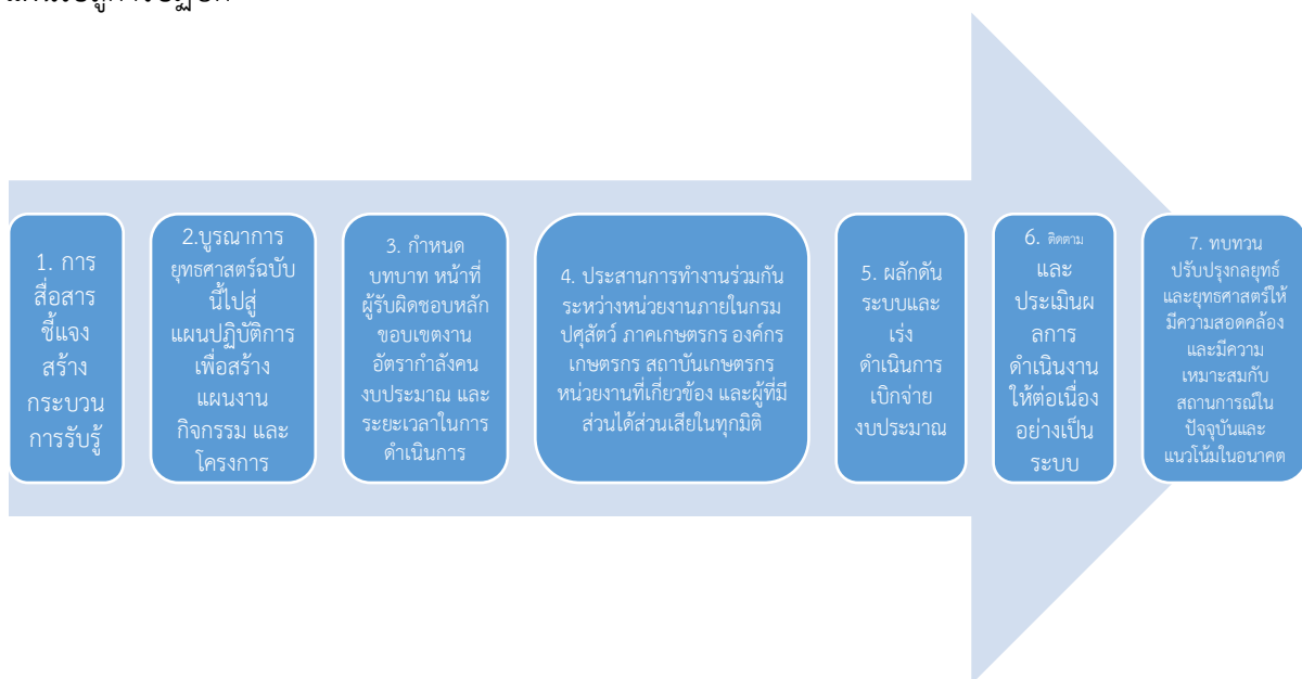
ภาพที่ 1. กระบวนการแปลงแผนไปสู่การปฏิบัติ

7) วิเคราะห์และประเมินปัจจัยแวดล้อม ร่วมกับการพิจารณาผลการดำเนินงาน ปัญหาในการขับเคลื่อนยุทธศาสตร์ในช่วงที่ผ่านมา เพื่อทบทวน ปรับปรุงกลยุทธ์และยุทธศาสตร์ให้มีความสอดคล้อง และมีความเหมาะสมกับสถานการณ์ในปัจจุบันและแนวโน้มในอนาคต ดังจะเห็นได้จากภาพที่ 1. กระบวนการแปลงแผนไปสู่การปฏิบัติ