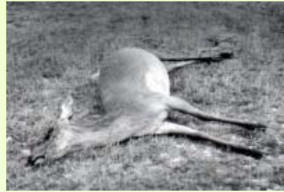
การตายของกวางเนื่องจากโรค MCF

เป็นสาเหตุใหญ่ที่ทำให้เกิดการตายในกวางที่โตแล้ว ปีละ 1-2 เปอร์เซ็นต์ในฝูงกวางแห่งชาติของประเทศนิวซีแลนด์ เป็นโรคที่เกิดจากเชื้อไวรัส จึงไม่มีวัคซีนป้องกัน เมื่อกวางติดเชื้อแล้วส่วนใหญ่กวางจะต้องตาย และมักตายอย่างรวดเร็ว โดย