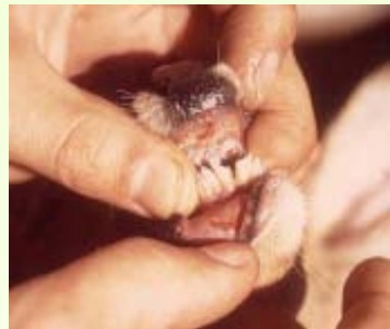
โรคปากและเท้าเปื่อยในกวางฟอลโลพปุ่มหนองที่ลิ้นและเหงือก ระยะ 3 วัน

เป็นโรคระบาดอย่างรุนแรง เกิดจากเชื้อไวรัส เชื้อจะเข้าทางผิวหนัง บางบริเวณปาก เหงือก ลิ้น ห้วนม และเต้านม ระหว่างร่องกีบ และรอบเส้นเลือดเหนือกีบ ทำให้เกิดเป็นแผลพองเจ็บปวด และเชื้อจะกระจายไปอย่างรวดเร็ว ในกวางระยะเชื้อฟักตัว 1 - 7 วัน เฉลี่ย 3 - 6 วัน