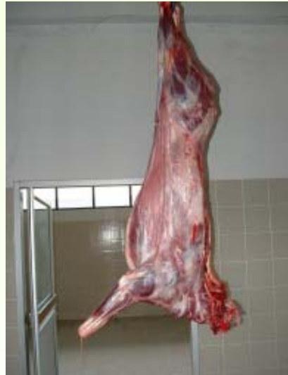
ลักษณะซากกวางรูซ่า