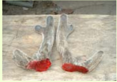
เขากวางอ่อน

กวางตัวผู้จะเริ่มสร้างเขาแรกหรือเขาเทียน (spike) เมื่ออายุ 1 ปี จากปุ่มส่วนหน้าของหัวกะโหลกซึ่งเจริญจากส่วนของเนื้อเยื่อชั้นนอก (epidermis) โดยอกติดกะโหลก