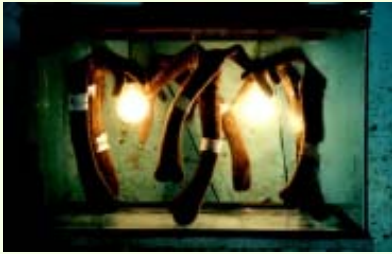
ตู้อบเขากวางอ่อนทำจากตู้เลี้ยงปลา

กรรมวิธีดั้งเดิมจะตั้งกะทะคั่วทรายให้ร้อน นำเขอ่อนลงคั่ว (คล้ายกับการคั่วเกลือ) หรือหากจะไม่ทำให้แห้งทันที ก็จะใช้วิธีเก็บรักษาโดยนำไปแช่เย็น ในปัจจุบันวิธีนิยมคือ เอาผ้าพันเขากวางไว้เหนือเตา โดยใช้ไฟอ่อนๆ รมเขากวางต้องคอยดูความแรงของไฟตลอดเวลาถ้าไฟแรงเกินไปเขาจะแตกและไหม้ การอบเขากวางต้องอาศัยประสบการณ์และความชำนาญมาก บางครั้งถ้าใช้ไฟอ่อนเกินไปเขาก็จะเน่าเสียได้ หรือภายนอกแห้งแต่ภายในอาจไม่แห้ง เขากวางไหม้ ขายได้ราคาต่ำส่วนใหญ่ผู้เลี้ยงนำมาขอซื้อในราคาประมาณคู่ละ 2,000 บาท ทั้งนี้เพื่อนำไปต้มผสมกับน้ำผึ้งให้ม้ากินเพื่อเพิ่มพลังกำลังให้ม้า