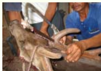
การตัดเขากวางโดยใช้เลื่อยตัด ห่างจากฐานเขา 3 - 4 ซม.

การตัดเขากวางอ่อนจะเริ่มตัดกันเมื่อเขากิ่งสุดท้ายเริ่มแตกแยกออกมาจากก้านยาวไม่เกิน 2 นิ้ว จากการสังเกตในระยะนี้เขากวางจะเจริญเติบโตรวดเร็ว เฉลี่ยประมาณวันละ 1 - 2 ซม. หรือจะคำนวณจากการหลุดของ