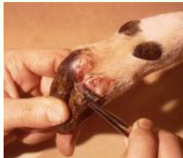
ลักษณะอาการโรคปากและเท้าเปื่อย ติดเชื้อที่บริเวณกีบเท้า

การกระจายของเชื้อโดยทางหายใจและทางเดินอาหาร กวางจะเริ่มมีไข้ แผลพุพองบนผิวหนังและเซลล์เมมเบรน ทำให้เกิดความเจ็บปวดบริเวณที่ติดเชื้อ ข้อสันนิษฐานว่าติดเชื้อนี้ในระยะขั้นต้นโดยสังเกตกวางจะใช้ลิ้น舐ตัวครีมีปากและขาเจ็บเดินกระตุกกระดก หลังจากนั้นที่เชื้อเข้าสู่กระแสโลหิตแล้ว กวางจะมีอาการไม่กินอาหาร น้ำหนักตัวลดลง