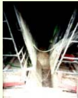
ชองบังคับตัวกวาง