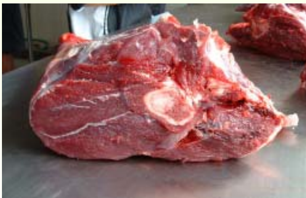
เนื้อกวาง

เนื้อกวางมีไขมันปริมาณค่อนข้างต่ำและมีไขมันประเภทอิ่มตัว (มีคลอเรสเตอรอลที่เป็นสาเหตุไขมันอุดตันในเส้นเลือด) อยู่ไม่มากนัก ขณะเดียวกันกรดไขมันในเนื้อกวางเป็น essential fatty acid มีอยู่ในปริมาณค่อนข้างสูง ซึ่งเป็นกรดไขมันที่จำเป็นที่ร่างกายมนุษย์ไม่สามารถสังเคราะห์ขึ้นมาใช้เองได้