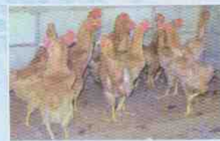
ภาพไก่เบตงอายุ 20 สัปดาห์