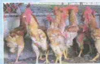
ภาพไก่เบตงอายุ 16 สัปดาห์