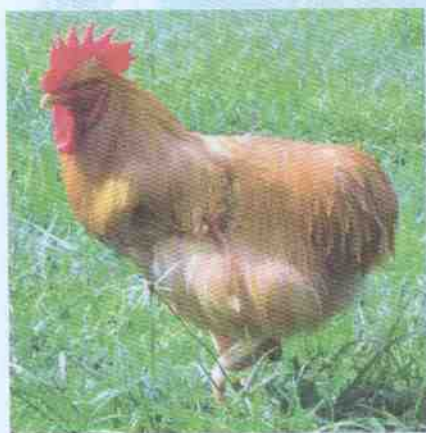
ไก่เบตงเพศผู้

- น้ำหนักตัวผู้หนัก 2 - 3 กิโลกรัม ตัวเมียหนัก 2 - 2.5 กิโลกรัม