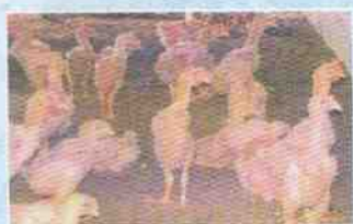
ภาพไก่เบตงอายุ 8 สัปดาห์