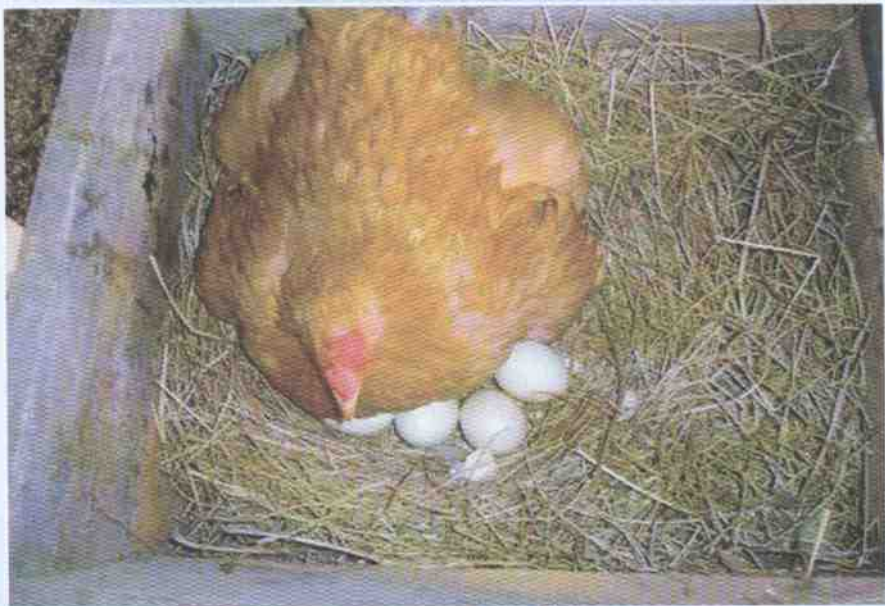
การฟักโดยแม่ไก่

เมื่อแม่ไก่ไข่ครบจำนวนแล้ว แม่ไก่จะนอนกกไข่ตลอดคืน และออกหากินในเวลาเช้า กลางวันจะขึ้นกกไข่ครั้งประมาณ 2 ชั่วโมง แล้วลงจากรังไข่ออกหากินสลับกัน เมื่อฟักไข่ออกได้ประมาณ 5-7 วัน ควรเอาไข่มาส่องดูเชื้อ โดยใช้กระดาษแข็งมาม้วนเป็นรูปกระบอก เอาไข่ไก่มาขีดที่ปลายท่อด้านหนึ่งแล้วยกขึ้นส่องดูกับแสงแดด ไข่ที่มีเชื้อจะเห็นมีจุดดำอยู่ข้างในและมีเส้นเลือดกระจายออกไป แม่ไก่ใช้ระยะเวลา 21 วัน จึงจะฟักออกเป็นตัว เมื่อลูกไก่ฟักออกหมดแล้วควรเอาฟางที่รองรังไข่เผาทิ้งเสีย และทำความสะอาดรังไข่