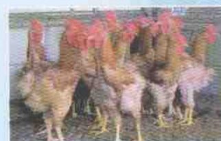
ภาพไก่เบตงอายุ 18 สัปดาห์