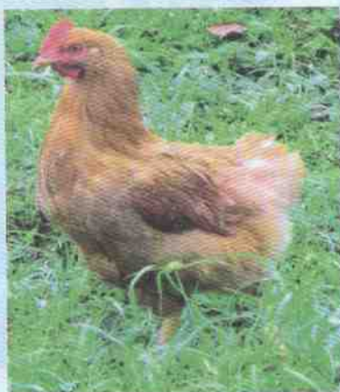
ไก่เบตงเพศเมีย