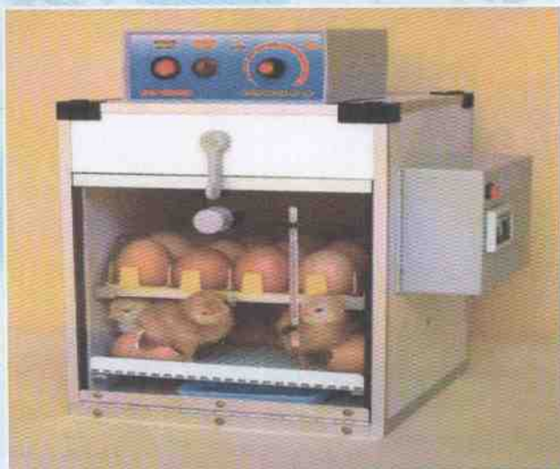
เครื่องฟักไข่