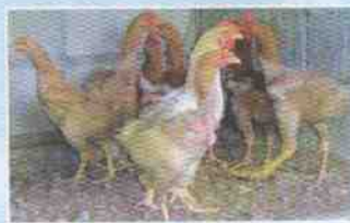
ภาพไก่เบตงอายุ 12 สัปดาห์