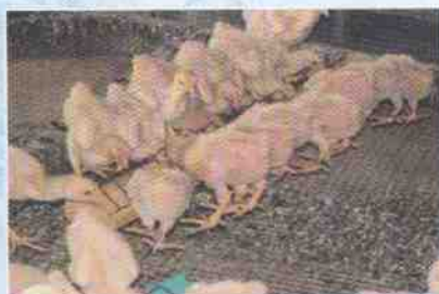
ภาพไก่เบตงอายุ 4 สัปดาห์