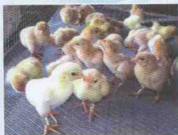
ภาพไก่เบตงแรกเกิด