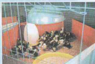
ภาพการกกลูกไก่ด้วยหลอดไฟ