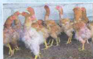
ภาพไก่เบตงอายุ 14 สัปดาห์