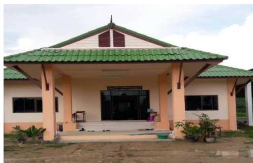
สนง.ปศอ.บ้านธิ