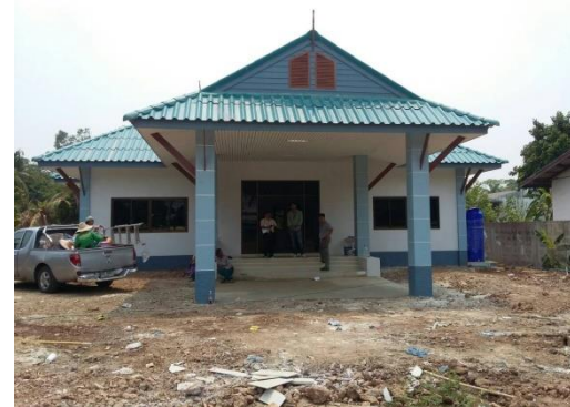
สนง.ปศอ.พรหมพิราม