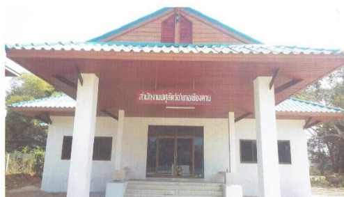
สนง.ปศอ.เขียงคาน