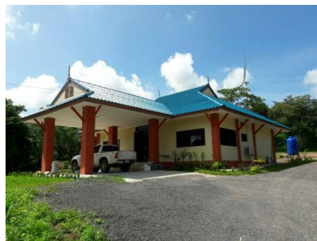
สนง.ปศอ.เทพสถิต