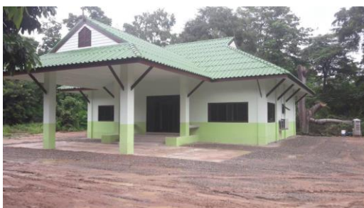
สนง.ปศอ.สันป่าตอง