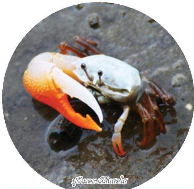
ปูก้ามดาบสีส้มสดใส

"ศูนย์ศึกษาและพัฒนาอ่าวคุ้งกระเบน อันเนื่องมาจากพระราชดำริ" ตั้งอยู่ที่หมู่ 4 ต.คลองขุด อ.ท่าใหม่ จ.จันทบุรี เปิดทุกวัน เวลา 08.00-18.00 น. การเดินทางจากตัวเมืองจันทบุรี ไปตาม ถนนสุขุมวิท (ทางหลวงหมายเลข 3) ถึงหลักกิโลเมตรที่ 301 จะมีแยกเลี้ยวซ้ายเข้าไปตามทางหลวงหมายเลข 3399 อีกประมาณ 18 กม. ก็จะถึงยังที่ทำการศูนย์ ผู้สนใจ สอบถามเพิ่มเติมได้ที่ ศูนย์บริการนักท่องเที่ยวอ่าวคุ้งกระเบน โทร. 0-3938-8116-8