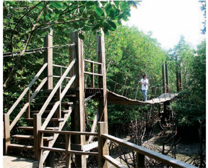
สะพานแขวนในเส้นทางเดินศึกษาธรรมชาติ

ระหว่างทางเดินมีสะพานแขวนที่เป็นทั้งจุดชมวิวและมุมถ่ายรูปของนักท่องเที่ยว นอกจากนั้นสะพานไม้ทอดยาวไปสู่ปากอ่าว มีศาลาชมวิวให้ยืนชมธรรมชาติรับลมทะเล และมีอนุสรณ์ "หมูดุด" หรือ "พะยูน" หรือที่บางคนเรียกว่า "วัวทะเล" ซึ่งแต่เดิมหมูดุดเคยมีที่อ่าวคุ้งกระเบนเป็นจำนวนมาก แต่ปัจจุบันสูญพันธุ์กลายเป็นตำนาน ทางศูนย์ศึกษาฯ จึงจัดทำอนุสรณ์หมูดุดไว้ให้ความรู้แก่ผู้ที่เข้ามาชม และ