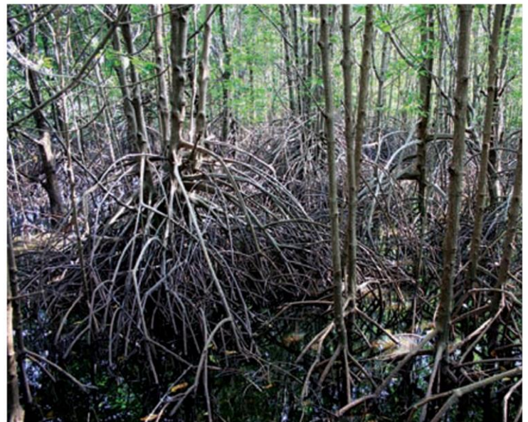
รากต้นโกงกางที่แผ่ไปไกล