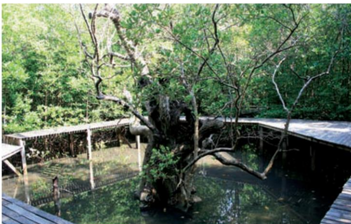
ปูแสมขาว อายุกว่า 200 ปี