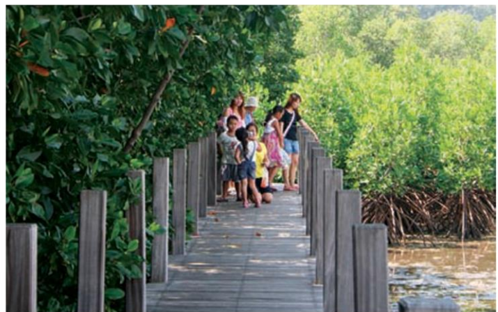
เส้นทางเดินศึกษาธรรมชาติเลียบทะเล