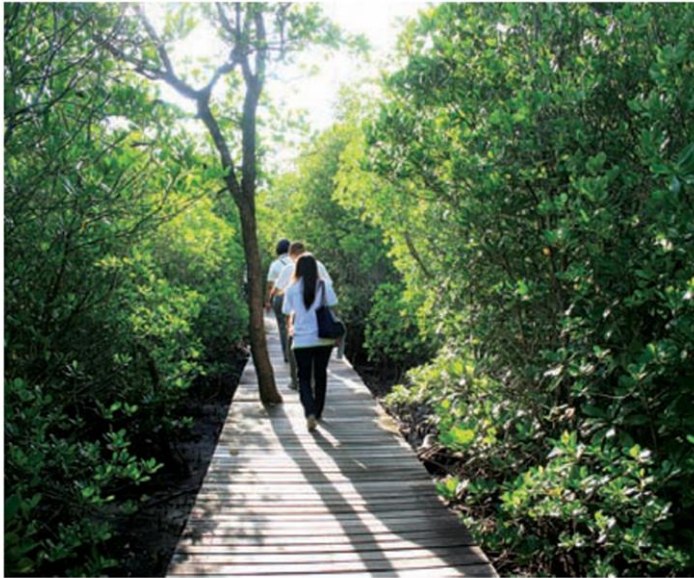
ความอุดมสมบูรณ์ของป่าชายเลนเห็นได้ตลอดเส้นทาง

หนึ่ง และยังคงกลายเป็นห้องเรียนธรรมชาติและสถานที่ท่องเที่ยวอันโดดเด่นแห่งภาคตะวันออก ที่นักท่องเที่ยวต่างเดินทางมาชมสีสันของพืชและสัตว์บนสะพานไม้ในเส้นทางศึกษาธรรมชาติของอ่าวคุ้งกระเบนอันร่มรื่น